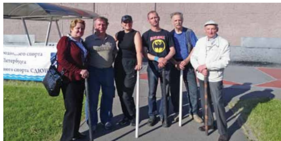
В соревнованиях по городскому спорту спортсмены «ТЭК СПб» заняли 4 место.

Поздравляем спортсменов ГУП «ТЭК СПб» с серьезной победой! Молодцы!