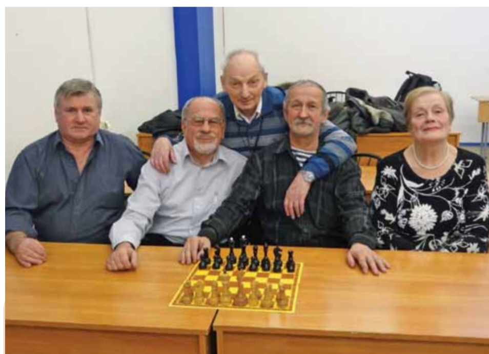
Победитель шахматного турнира - сборная «ТЭК СПб».