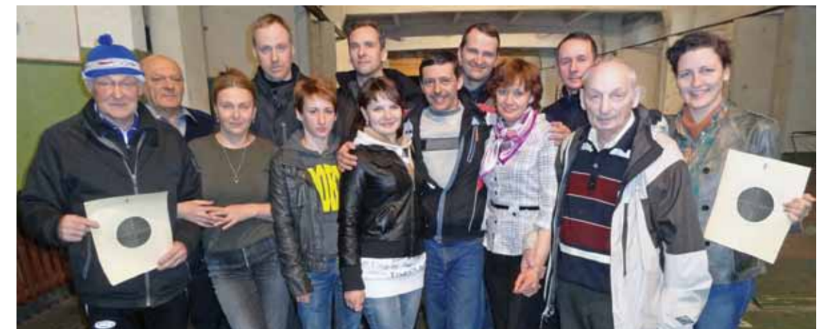
Стрелки «ТЭК СПб» взяли «золото»

ром. Также мужская волейбольная команда взяла «бронзу». Впереди участников спартакиады-2013 стали лыжные гонки, в которых мужчины бежали 5км, а женщины – 2,5км. Из-за болезни нескольких сильных лыжников команда предприятия заняла только третье место, уступив «Водоканалу» и «Адмиралтейцу». Зато 24 апреля стрелки «ТЭК СПб» уже взяли «золото» в тире. Как в прошлом, так