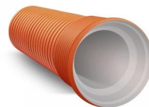
Трубы для безнапорных подземных систем наружной канализации